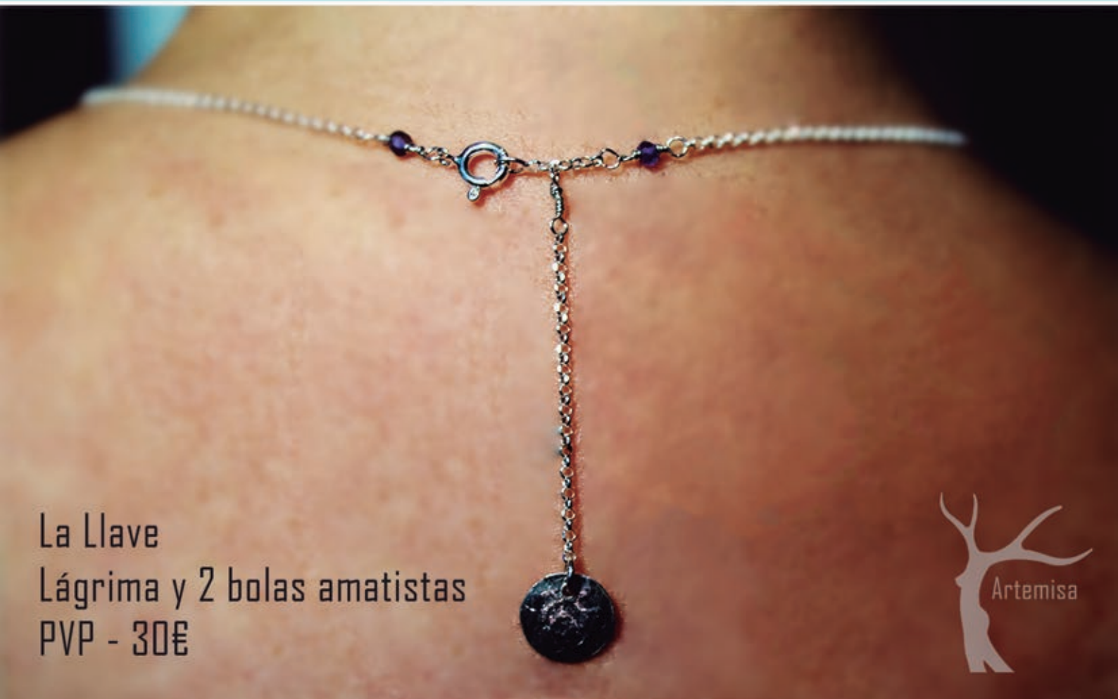
La Llave Lágrima y 2 bolas amatistas PVP - 30€